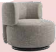
New K-Wait Texture des. R. Dordoni