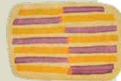
Parays des. P. Urquiola