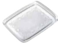
Teatime des. P. Starck