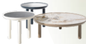
K-Top des. R. Dordoni