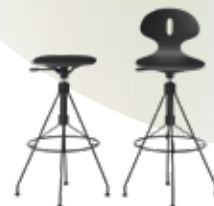
C.Koya des. P. Starck