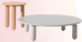
Undique Mas des. P. Urquiola