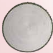
New K-Lim des. R. Dordoni