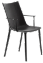
H.H.H. des. P. Starck