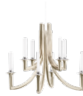
Khan des. P. Starck