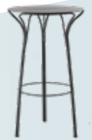
New Hi-Ray table des. L.+R. Palomba