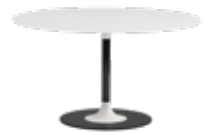
Thierry XXL des. P. Lissoni