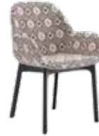
Clap Rubelli des. P. Urquiola