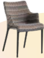
Eleganza Missoni des. P. Starck