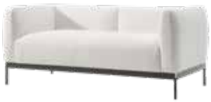
ASIA des. P. Lissoni