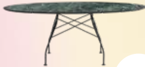
Glossy Marble des. A. Citterio with O. Löw