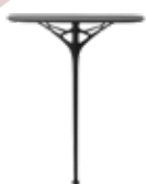
A.I. Console des. P. Starck