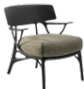
A.I. Lounge des. P. Starck