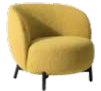
Lunam Curly des. P. Urquiola