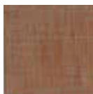
3C rouge orangé