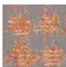
3G rouge orangé-beige